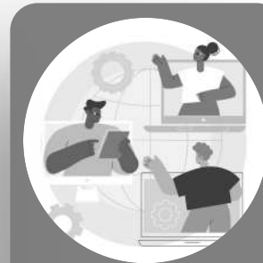
Bagian Empat Daftar Pertanyaan yang Sering Diajukan (FAQs)