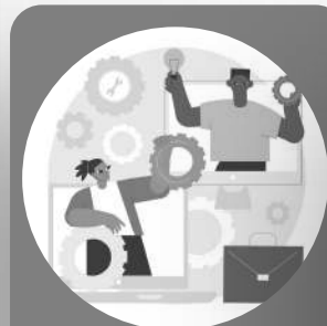
Bagian Dua Mekanisme Seleksi dan Penetapan Penerima Bantuan