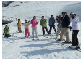
Skiing in Hakusan